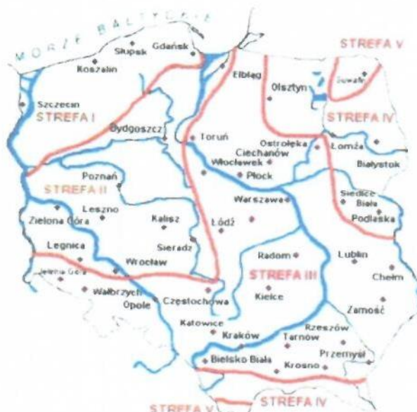
Rys. 1 Strefy klimatyczne Polski i temperatury obliczeniowe

Położenie obiektu, w którym planowany jest montaż, na mapie ma wpływ na pracę instalacji. W zależności od współrzędnych geograficznych rozbieżności w temperaturach projektowych mogą mieć znaczącą wartość. W skali kraju ilustruje to poniższa mapa (Rys. 1).