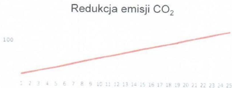
Rys. 3. Redukcja emisji CO 2

Instalacja grzewcza z wykorzystaniem kotła na paliwo gazowe ma znaczny wpływ na środowisko. Produkcja energii cieplnej z wykorzystaniem gazu ziemnego pozwala na redukcję emisji dwutlenku węgla, która miałaby miejsce w wypadku wytwarzania energii cieplnej w procesie spalania paliw kopalnych. Dla proponowanej instalacji wskaźnik ten pokazuje poniższy wykres (Rys.3).