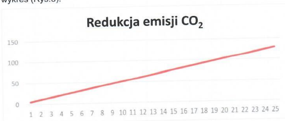
Rys. 3. Redukcja emisji CO 2

Instalacja grzewcza z wykorzystaniem kotła na paliwo gazowe ma znaczny wpływ na środowisko. Produkcja energii cieplnej z wykorzystaniem gazu ziemnego pozwala na redukcję emisji dwutlenku węgla, która miałaby miejsce w wypadku wytwarzania energii cieplnej w procesie spalania paliw kopalnych. Dla proponowanej instalacji wskaźnik ten pokazuje poniższy wykres (Rys.3).