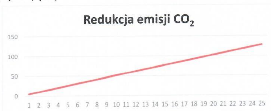
Rys. 3. Redukcja emisji CO 2

Instalacja grzewcza z wykorzystaniem kotła na paliwo gazowe ma znaczny wpływ na środowisko. Produkcja energii cieplnej z wykorzystaniem gazu ziemnego pozwala na redukcję emisji dwutlenku węgla, która miałaby miejsce w wypadku wytwarzania energii cieplnej w procesie spalania paliw kopalnych. Dla proponowanej instalacji wskaźnik ten pokazuje poniższy wykres (Rys.3).