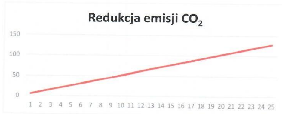
Rys. 3. Redukcja emisji CO 2

Instalacja grzewcza z wykorzystaniem kotła na paliwo gazowe ma znaczny wpływ na środowisko. Produkcja energii cieplnej z wykorzystaniem gazu ziemnego pozwala na redukcję emisji dwutlenku węgla, która miałaby miejsce w wypadku wytwarzania energii cieplnej w procesie spalania paliw kopalnych. Dla proponowanej instalacji wskaźnik ten pokazuje poniższy wykres (Rys.3).