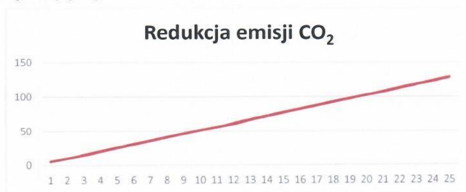
Rys. 3. Redukcja emisji CO 2

Instalacja grzewcza z wykorzystaniem kotła na paliwo gazowe ma znaczny wpływ na środowisko. Produkcja energii cieplnej z wykorzystaniem gazu ziemnego pozwala na redukcję emisji dwutlenku węgla, która miałaby miejsce w wypadku wytwarzania energii cieplnej w procesie spalania paliw kopalnych. Dla proponowanej instalacji wskaźnik ten pokazuje poniższy wykres (Rys.3).