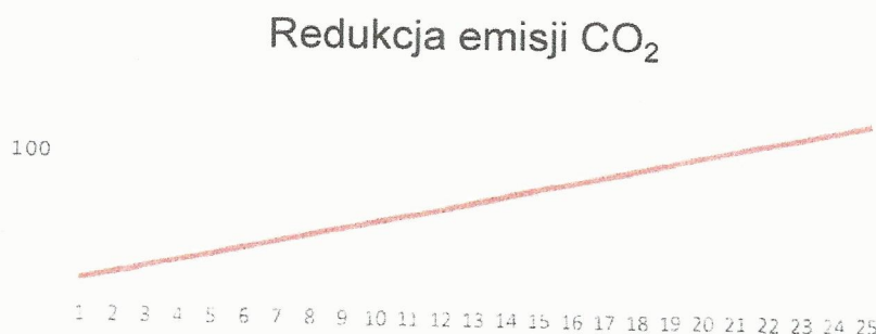
Rys. 3. Redukcja emisji CO 2

Instalacja grzewcza z wykorzystaniem kotła na paliwo gazowe ma znaczny wpływ na środowisko. Produkcja energii cieplnej z wykorzystaniem gazu ziemnego pozwala na redukcję emisji dwutlenku węgla, która miałaby miejsce w wypadku wytwarzania energii cieplnej w procesie spalania paliw kopalnych. Dla proponowanej instalacji wskaźnik ten pokazuje poniższy wykres (Rys.3).