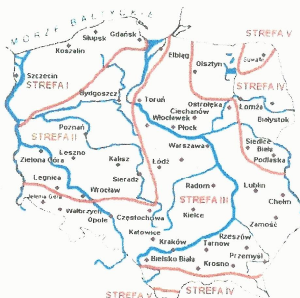
Rys. 1 Strefy klimatyczne Polski i temperatury obliczeniowe

Położenie obiektu, w którym planowany jest montaż, na mapie ma wpływ na pracę instalacji. W zależności od współrzędnych geograficznych rozbieżności w temperaturach projektowych mogą mieć znaczącą wartość. W skali kraju ilustruje to poniższa mapa (Rys.1).