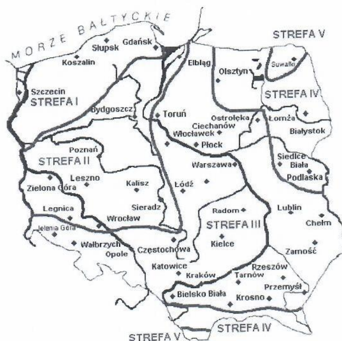
Rys. 1 Strefy klimatyczne Polski i temperatury obliczeniowe

Położenie obiektu, w którym planowany jest montaż, na mapie ma wpływ na pracę instalacji. W zależności od współrzędnych geograficznych rozbieżności w temperaturach projektowych mogą mieć znaczącą wartość. W skali kraju ilustruje to poniższa mapa (Rys.1).