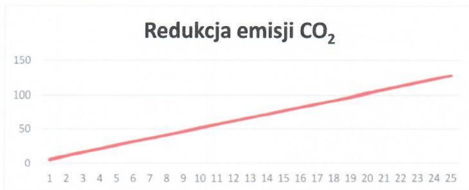
Rys. 3. Redukcja emisji CO 2

Instalacja grzewcza z wykorzystaniem kotła na paliwo gazowe ma znaczny wpływ na środowisko. Produkcja energii cieplnej z wykorzystaniem gazu ziemnego pozwala na redukcję emisji dwutlenku węgla, która miałaby miejsce w wypadku wytwarzania energii cieplnej w procesie spalania paliw kopalnych. Dla proponowanej instalacji wskaźnik ten pokazuje poniższy wykres (Rys.3).