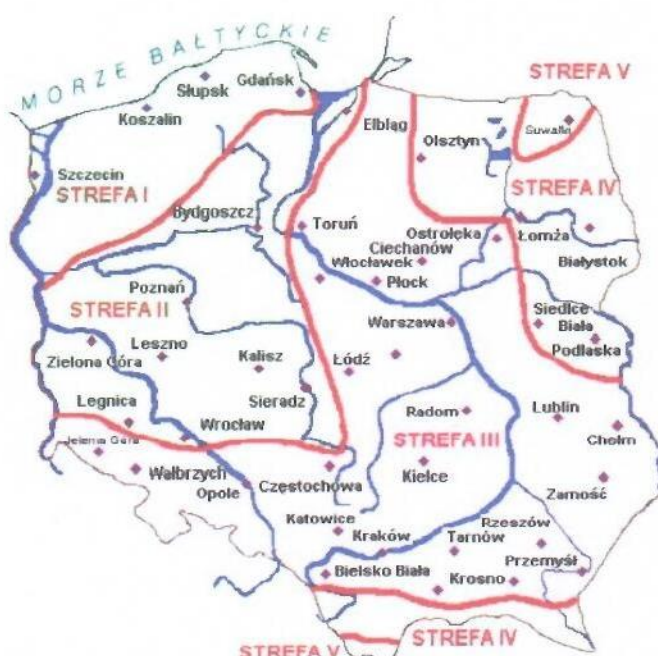
Rys. 1 Strefy klimatyczne Polski i temperatury obliczeniowe

Położenie obiektu, w którym planowany jest montaż, na mapie ma wpływ na pracę instalacji. W zależności od współrzędnych geograficznych rozbieżności w temperaturach projektowych mogą mieć znaczącą wartość. W skali kraju ilustruje to poniższa mapa (Rys.1).